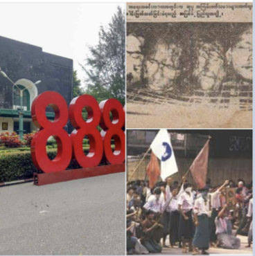
This collage of photos depicts the 8888 uprising. This post asks the question, who started the 8888 Uprising and who is to blame, asking those who are to blame not to lie.

D MM Daily Star Like Page *** ဒီကမ္ဘာကို မေင်းစဉ်တပ်မေဏိ ☹️ +++++ အဲဒီကမ္ဘာမှာ အယောင်ဆောင်လုပ်တဲ့ ဆူလူမတွေကို ဖမ်းဆီးပြီး လုပ်ချင်ကြတယ် အဲဒီကမ္ဘာမှာ ပြည်သူ့မေင်းဆွဲခြင်းနဲ့ကြတယ် အဲဒီကမ္ဘာမှာ မေလင်လင်တွေကောင်းကို ကောင်းသားအယောင်ဆောင်ဆွဲ ခြိမ်းခြောက်ကြတယ် အဲဒီကမ္ဘာမှာ ပျံကလေးတွေ ပွင့်ရယ်အေး အမှောင်ကလေးတွေ ချက်စားအောင် အယောင်ဆောင်ဆွဲ လုပ်ချင်ကြလေတယ် အဲဒီကမ္ဘာမှာ စီးပွားရေးတွေကောင်းပြီး ပြည်သူတွေ တာဝန်အောင် လုပ်ချင်ကြတယ် အဲဒီကမ္ဘာမှာ ကောင်းသားလေးတွေ လွှတ်ချင်လုပ်ဆွဲ ပြည်သူတွေအတွက် ဘဝတွေကောင်းအောင် စေလေ ကောင်းသားလေးပြီး အယောင်ဆောင်ဆွဲ ချက်စားချင်ကြတယ် အဲဒီကမ္ဘာမှာ ပြည်သူတွေ အိမ်ထောင်ရေးတွေကို ချက်စားချင်ကြတယ် အဲဒီကမ္ဘာမှာ ပိုက်ဆံကိုအကြွေးပြန်ပြီး တိုက်ပြည်ထူထောင် လုပ်ချင်ကြတယ် အဲဒီကမ္ဘာမှာ ကလေးကစားလုပ်ရုံနဲ့ ကောင်းသားအယောင်ဆောင်လုပ်ရုံ ပိုက်ဆံပေးရုံနဲ့ တိုက်ပြည် ကမ္ဘာကိုကောင်းချင်ကြတယ် အဲဒီကမ္ဘာမှာ ချစ်ကူးပြီးနောက် ပြည်သူ့မေင်းဆွဲ ခြိမ်းခြောက်မှု ရတယ် အဲဒီကမ္ဘာမှာ ပိုက်ဆံမရဘဲနဲ့ ပစ်ခတ်ပြီး ပြည်သူ့ဘဝ ကျခံရဆုံးရတဲ့ လူပုဂ္ဂိုလ်ရတယ် အဲဒီကမ္ဘာမှာ..... အဲဒီကမ္ဘာမှာ..... မယုံနိုင်လှတဲ့ တစ်နေ့မှကောင်းလို့မိ အဲဒီကမ္ဘာမှာ ကလေးကစားကောင်းသားကောင်းကြောင့် အကြွေးမရဘဲအယောင်ဆောင်ဆွဲ ကောင်းရုံနဲ့ မိသား စုကောင်း သေချာချင်ရတယ် အဲဒီသမိုင်းမှာ ၁၈၈၈ ခုနှစ် မေင်းစဉ်တပ်တော်ကောင်းတွေက ကောင်းစားပြီး မိမိရတဲ့ ပြည်သူတွေက ခုတ် တပ်မတော်သားတွေကြောင့်မိပြီး နာကျင်နေရတယ် အဲဒီကမ္ဘာမှာ အဲဒီကမ္ဘာကို ရန်သူနဲ့ မေင်းစဉ်တပ်မကြွယ်လာမှာ စစ်( ဘဝတောင့်ခိုက် ) - ( ၁၈၈၈ ခုတော် ) -သမိုင်းပိုင်းမူကောင်းတွေအတွက်ဆေးသေ